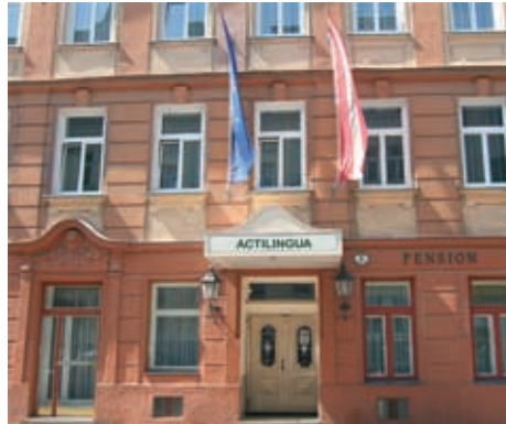
Kürzlich renoviertes, typisches Wiener Jugendstilhaus

Die Schule und das Stadtzentrum sind in 10-15 Minuten mit den öffentlichen Verkehrsmitteln zu erreichen.