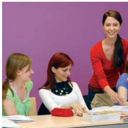
Enseignants qualifiés et motivés.

Leçons: Cours d'allemand pour professeurs standard: 25/sem.: cours de profs (20) + programme culturel (5) ou Cours d'allemand pour professeurs intensif: