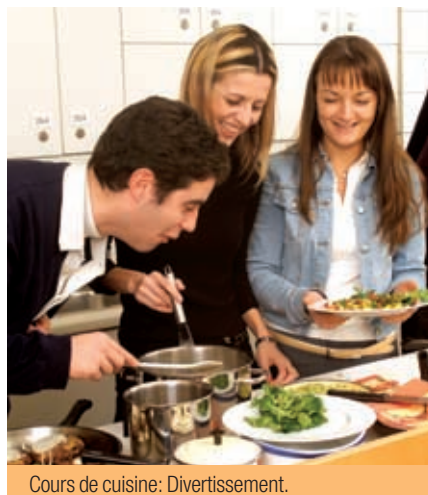
Cours de cuisine: Divertissement.

weekends. Nous organisons des excursions à Salzbourg « la ville de Mozart », à Graz, capitale de la Styrie, à Klosterneuburg, la ville de la célèbre famille des Babenberger et à Wachau, dans la vallée du Danube. L'été, nous allons nager dans le lac de Neusiedel et goûtons aux saveurs des vins autrichiens dans un « Heuriger ». Sur la Donauinsel (l'île du Danube), vous pouvez nager, faire des randonnées en bicyclette, de la voile, du surf ou pratiquer le ski nautique et jouer au volley-ball ou au football. Le montant à payer pour les excursions d'une journée est à régler directement à Vienne (ce montant couvre toutes les dépenses).