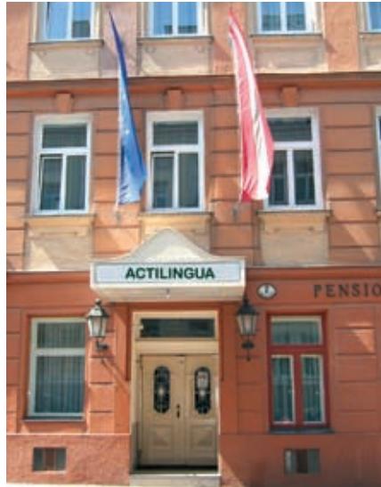
Résidence ActiLingua appartenant à l'école!