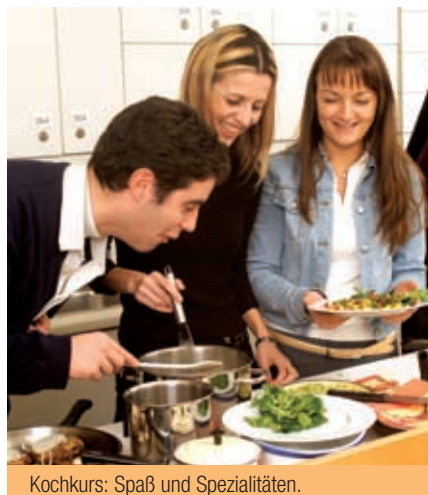
Kochkurs: Spaß und Spezialitäten.

Die Kosten für jeden Tagesausflug sind direkt in Wien zu bezahlen (=Selbstkostenpreis).