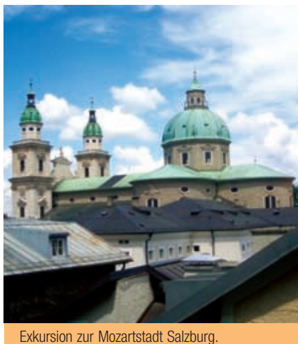
Exkursion zur Mozartstadt Salzburg.

Am Wochenende rufen Kultur und Natur. Wir organisieren Ausflüge in die Mozartstadt Salzburg, die steirische Hauptstadt Graz, die Babenbergerstadt Klosterneuburg oder in das berühmte Donautal, die „Wachau“. Im Sommer fahren wir zum