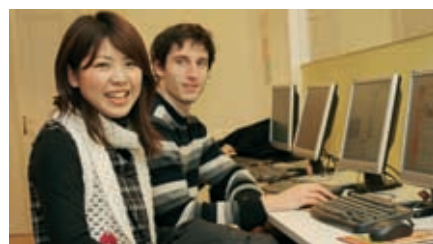
Gratis W-LAN in der ganzen Schule.

Kombinieren Sie Ihren Deutschkurs mit einem Schitag am Wochenende! Fordern Sie unser detailliertes Programm an.