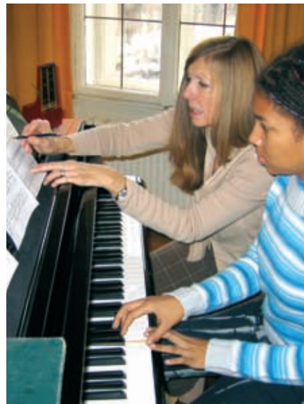
Deutsch und Musik.

Alle Deutschkurse (auch die Spezialkurse) mit einer Dauer von 12 oder mehr Wochen sind mit bis zu 30 % deutlich preisreduziert! Der Rabatt ist in der Preisliste bereits berücksichtigt.