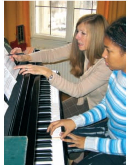
Немецкий язык и музыка.