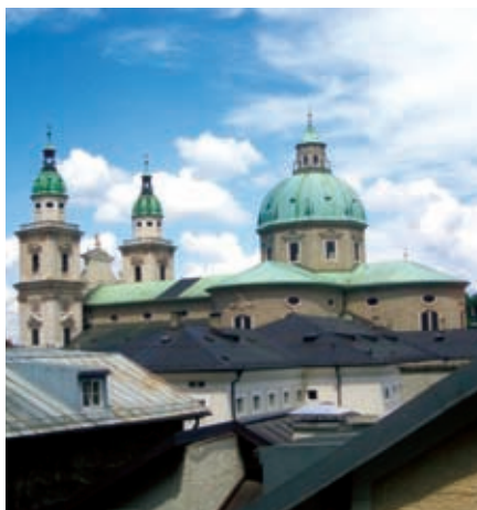
Экскурсия в город Моцарта Зальцбург.

На выходных вас ждут природа и культура. Мы организуем поездки в родной город Моцарта Зальцбург, столицу