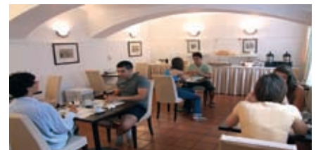
Завтрак в отеле ActiLingua.

Обстановка: одно- или двухместные комнаты. В большинстве комнат есть собственный душ, туалет и телефон.