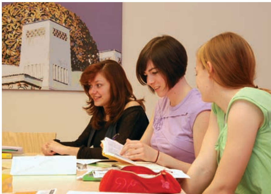
Учеба в маленьких группах гарантирует успех.

Комбинаторный курс, совмещающий классические групповые и индивидуальные занятия. Во время индивидуальных занятий