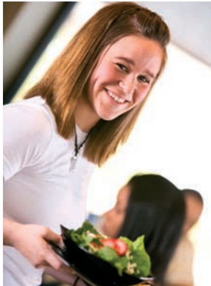
Практика в гостинице.