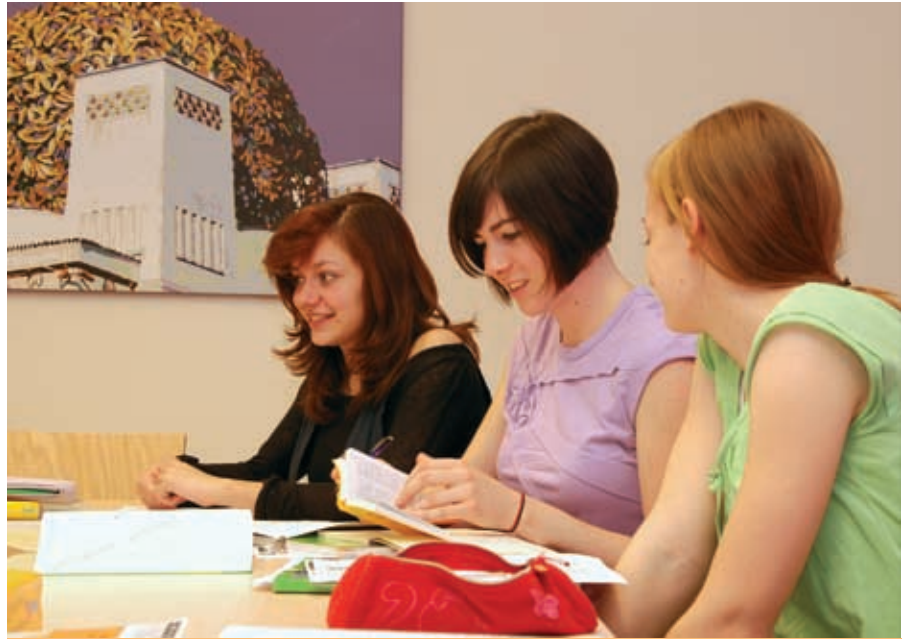
Aprendizaje en grupos reducidos, con resultados garantizados.

Combinación de clases en grupo (c. estándar) con clases individuales. En las clases individuales puede centrarse en sus