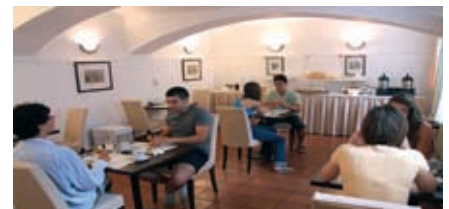
Buffet de desayuno en la Residencia ActiLingua.

Tendrá una habitación individual en la casa de estudiantes muy bien situada. Disponibilidad: julio, agosto. Comidas: Desayuno o media pensión. Uso de la cocina. Dotación: habitaciones individuales o dobles. La mayoría de las habitaciones tienen ducha, WC y teléfono.