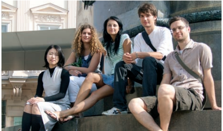
El programa de cultura actual se colgará en la escuela todas las semanas.